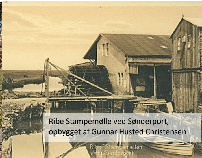
Ribe Stampemølle ved Sønderport, opbygget af Gunnar Husted Christensen